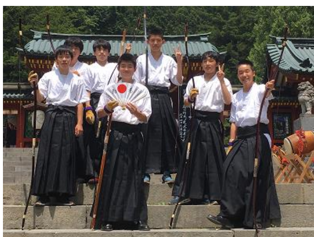
日光・扇の的大会に参加(8月)