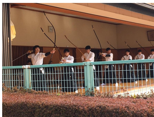
大会の様子 一人4射し、チーム合計的中数を競います。